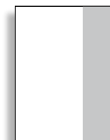
1/3 hoch 70 x 297 mm