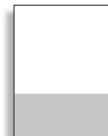
1/3 quer 210 x 99 mm