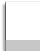
1/4 quer 210 x 74 mm

Alle Anzeigenformate liegen im Anschnitt (Breite x Höhe) + jeweils 3 mm Beschnitt an den außenliegenden Kanten! Textabstand zum Rand: mind. 8 mm! Anzeigen im Satzspiegel auf Anfrage möglich.